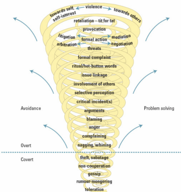
Figuur 1: Conflict Spiraal, aangepast vanuit het model van Pruitt & Kim (2004)

Vanwege het publiek karakter wordt het conflict beïnvloed door factoren die buiten de invloedssfeer liggen van de partijen. Eén van deze factoren is de druk vanuit de Zuid-Amerikaanse inheemse beweging die van mening is dat het hoogtijd is dat de regering van Suriname de grondenrechten van inheemse en marron gemeenschappen regelt. Een andere factor is de wereldwijde verbetering van de positie van tribale volken in de afgelopen dertig jaar. De druk van deze externe factoren tezamen met de steeds meer uiteenlopende positie van de partijen draagt bij tot de escalatie van het conflict (Folger, Poole & Stutman, 2005). Volgens Pruitt & Kim (2004 p.255), bevinden de partijen zich in een fase van polarisatie, waarbij "het vertrouwen en respect is bedreigd, en vervorming van percepties plaatsvindt en stereotypen ontstaan". Zij zijn zelf niet in staat een onderhandeling te voeren waardoor een formeel conflictresolutie proces moet worden ingezet.